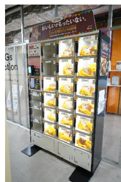
市営地下鉄関内駅