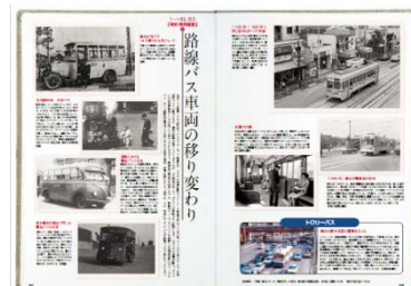
(第2部ページイメージ)