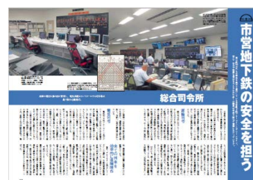
(第3部ページイメージ)