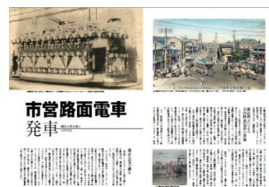
市営路面電車 発車