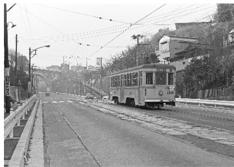
【昭和46（1971）年 山元町】