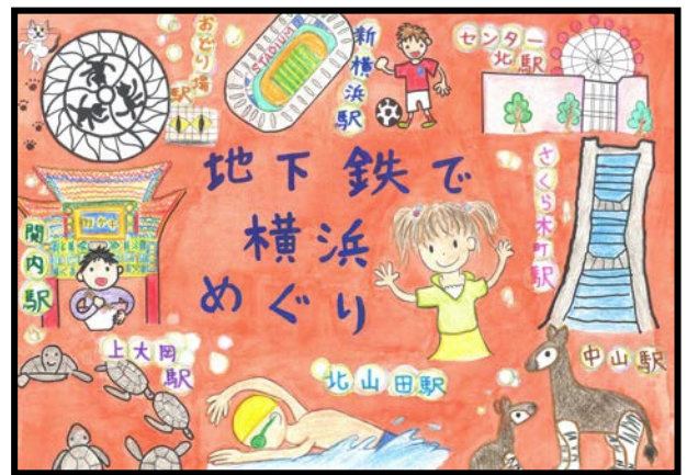
平成 30 年度 横浜市長賞 受賞作品