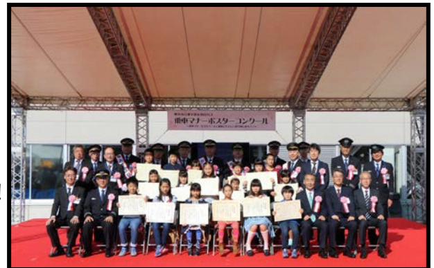
平成 30 年度 表彰式写真