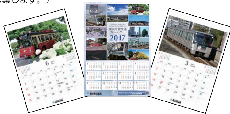
【参考】市営交通カレンダー2017

平成 29 年 6 月 5 日 (月) ～ 7 月 10 日 (月) ※消印有効