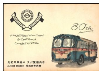
パズル型記念乗車券のデザイン ※「民生観光バス」(昭和26年) リヤエンジン最初の観光バス