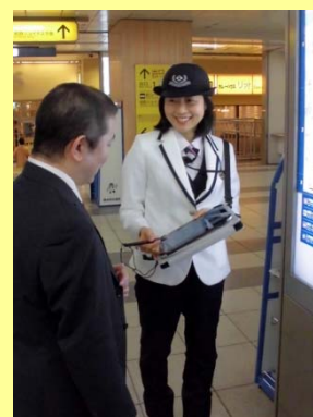
ステーションアテンダント