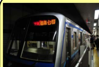
ブルーライン快速運転