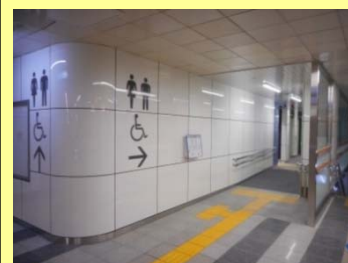
横浜駅トイレリニューアル