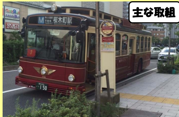
あかいくつの停留所「みなとみらい駅前」を新設