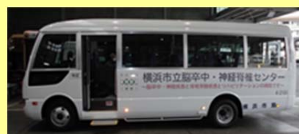
無料シャトルバスの運行