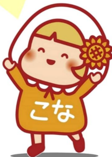
こうなん せいしん 港南ひまわりプラン推進キャラクター 「こなちゃん」