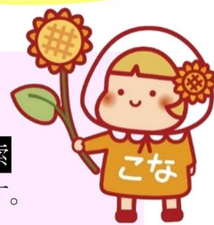
▲港南ひまわりプラン 推進キャラクター こなちゃん

③こども向けちらしは、上記3機関での配架やこども向けイベント等で配布します。（資料2）