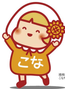
港南ひまわりプラン推進キャラクター こなちゃん