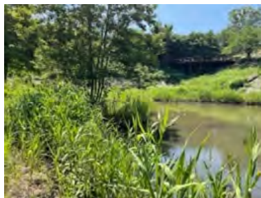
野庭団地第2遊水池