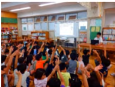
野庭団地第2遊水池 について勉強中！