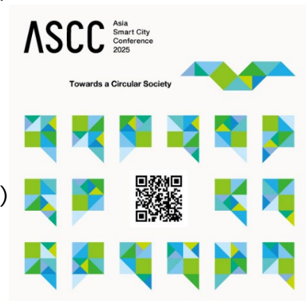
アジア・スマートシティ会議 2025 公式ウェブサイト

出展申込 : ウェブサイトから出展案内をご確認の上、お申し込みください。(申込期限:9月18日)