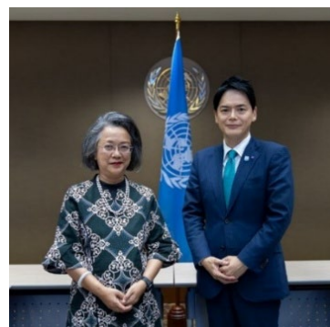
山中市長とアリシャバナ事務局長との会談 （令和 6 年 6 月、バンコク）