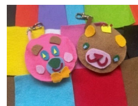
「ピースフルクマちゃんを作ろう!」 (作品イメージ)