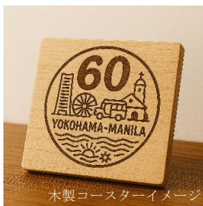
木製コースターイメージ

米粉とココナッツミルクをベースに塩漬け卵が入った、フィリピンではクリスマスシーズンに食べられる伝統的なライスケーキ。溶かしたチーズとココナッツフレークをトッピングし付け合わせにココナッツアイスクリーム、ホイップクリーム、キャラメルソースで仕上げました。甘じょっぱさと香ばしさのバランスが絶妙なスイーツ。