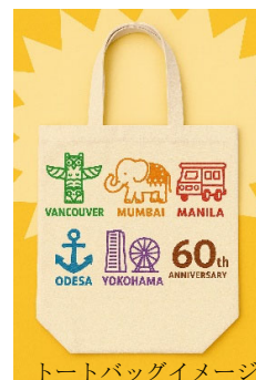
トートバッグイメージ