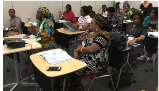
2017年交流プログラムの様子

横浜市は JICA との連携によりこのプログラムの実施に全面的に協力し、これまでアフリカの20か国から計88名を受入れています。