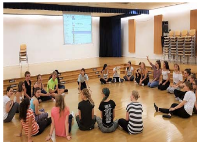
横浜ゆかりのダンサー 2 名がフランクフルトを訪問し、マイン祭りでのステージパフォーマンスやワークショップを開催。(2018 年 8 月)