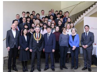
市立桜丘高等学校生徒が姉妹校のシュレ・アム・リードと 2018 年に姉妹校提携。初訪問時にフランクフルト市役所にて市長を表敬訪問 (2019 年 2 月)