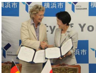
フランクフルト市とのパートナー都市協定提携式 (2011 年 9 月) ※写真はロート前市長

平成 23 (2011) 年 9 月に経済、温暖化対策、文化芸術創造都市の分野を中心に連携を深めるとともに、市民、特に若い世代の交流を促進していくため、パートナー都市の協定を締結。〈これまでの主な交流事例〉