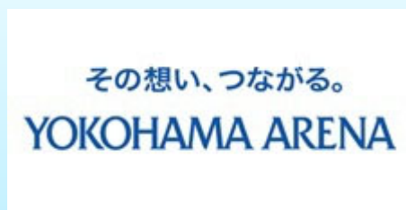
株式会社横浜アリーナ