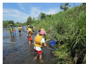
小学校向け講座の様子