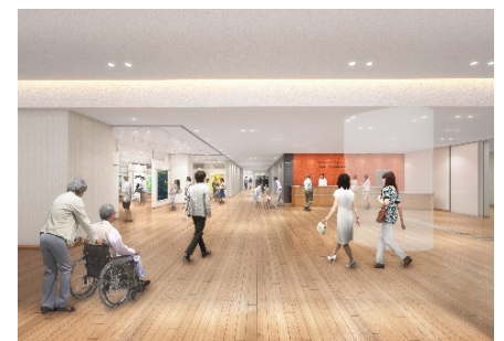
区民文化センターイメージ

皆さんから長く親しまれる愛称をおまちしています。 ぜひ、あなたのアイデアをお寄せください！