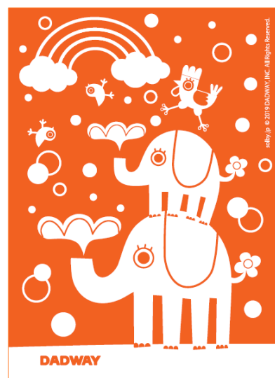
2010 年からダッドウェイがデザインし、港北区へ提供している小児医療証カバー (画像は 2019 年版)

株式会社ダッドウェイ概要 1992 年設立。本社は港北区新横浜。「お父さんの子育てをもっとおもしろくしたい！」をコンセプトにベビー用品、ペット用品の企画・開発、販売のほか、遊び場・親子カフェ運営等幅広い事業を展開。社会貢献事業にも積極的に取り組む。男女共同参画貢献推進賞受賞 (2015 年・横浜市政策局)、横浜健康経営認証 2018 クラス AA 表彰 (2 回目・横浜市健康福祉局)、よこはまグッドバランス賞 2018 (7 回継続賞・横浜市政策局)