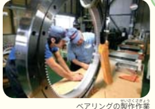
ベアリングの製作作業

横浜市営地下鉄ブルーライン「北新横浜駅」から徒歩約12分 11時 13時 14時