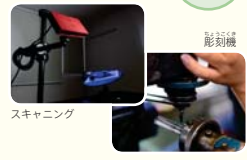
彫刻機 スキャニング