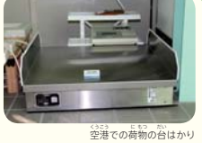
空港での荷物の台はかり

横浜市営地下鉄ブルーライン「北新横浜駅」から徒歩約12分 10時 11時 13時