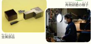
角物研磨の様子 金属部品