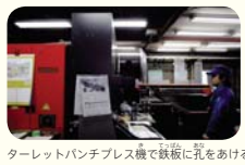
ターレットパンチプレス機で鉄板に孔をあける様子