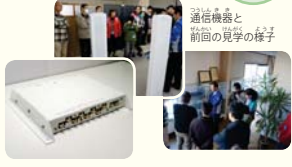
通信機器と 前回の見学の様子