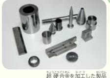
超硬合金を加工した製品

横浜市営地下鉄ブルーライン「北新横浜駅」から徒歩約12分 11時 13時 14時