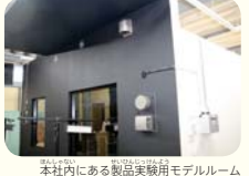
本社内にある製品実験用モデルルーム