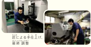
隙による手仕上げ、最終調整