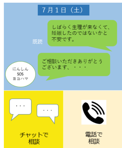
トーク画面イメージ