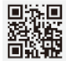
申し込み用二次元コード