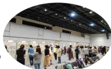
【昨年度の発表会の様子】