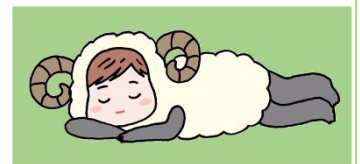
厚生労働省自殺対策キャラクター イラスト:細川貂々