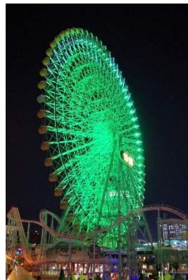
大観覧車「コスモクロック 21」