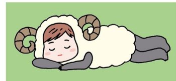
厚生労働省自殺対策キャラクター イラスト:細川貂々