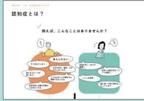
認知症かな？と思ったら