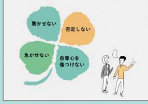
接し方の7つのポイント