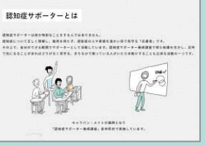
認知症キャラバン・メイトや認知症サポーターとは？