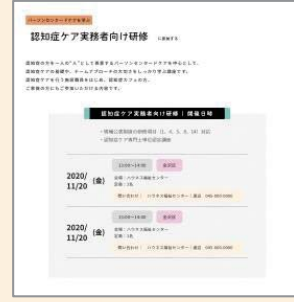
認知症ケア実務者向け研修に参加する