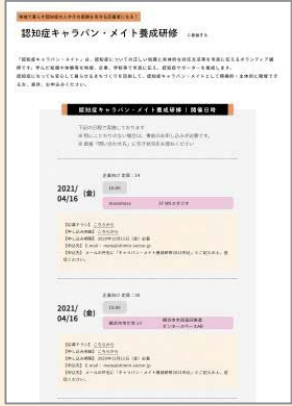
認知症キャラバン・メイト養成研修に参加する