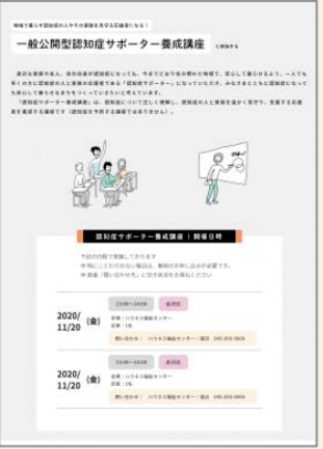
一般公開型認知症サポーター養成講座に参加する