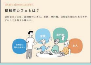
認知症カフェとは？