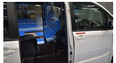
飛沫循環抑制車両