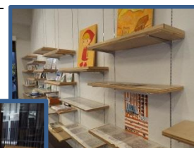
寿の歴史を学ぶ アーカイブ機能