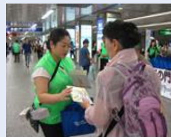
昨年度の取組の様子

なお、当日は、各鉄道会社様(JR、京急、東急、相鉄、みなとみらい、市営地下鉄)にご協力をいただいております。