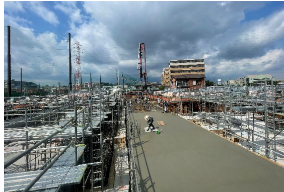
▲新築工事（コンクリート工事）