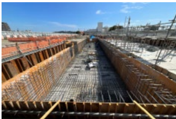
▲新築工事（配筋工事）