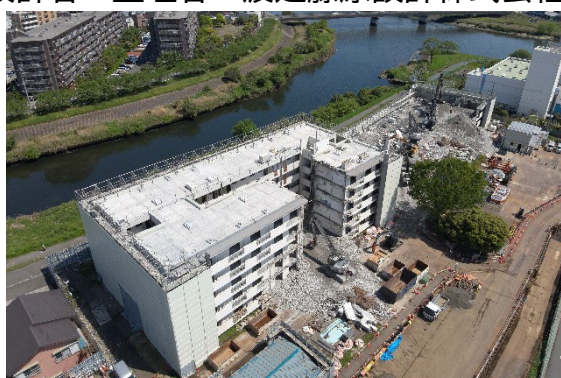
▲解体工事（令和 6 年度完了）