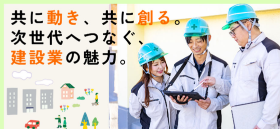
▲よこはま建設業魅力発信コンソーシアムイメージ