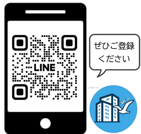
横浜市マンションお役立ち情報

「LINE」を活用することで、「情報を取りに行く」心理的負担を減らし、より手軽に必要な情報が届きやすくなります。 ※定期配信のコラムは、Google の検索キーワードデータを活用し、ニーズの高い内容を中心に配信していきます。