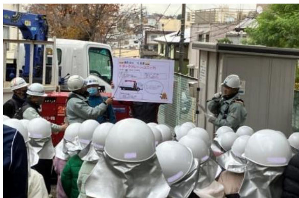
ユニック車の説明