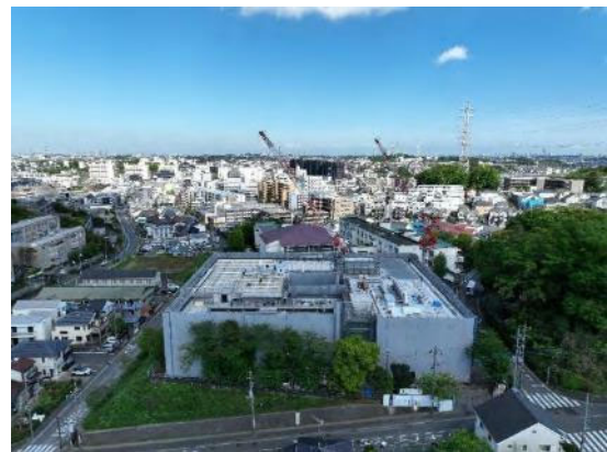
工事中の写真（令和6年4月撮影）

※ 当日取材を希望される場合は、前日16時まで下記お問合せ先までご連絡ください。 撮影は可能ですが、児童のプライバシー保護のため、掲載する写真は確認をさせていただきます。