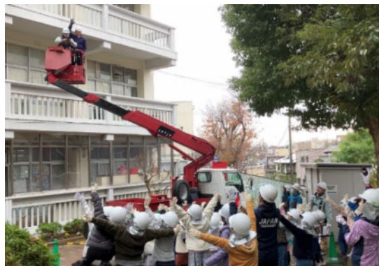
高所作業車の実演