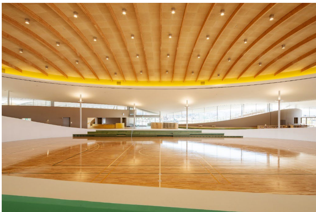
シェルターインクルーシブプレイス コバル 内観

※ 当日取材をされる場合は、1月22日（月）16:00 までに下記お問合せ先までご連絡ください。