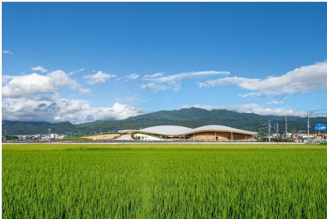
シェルターインクルーシブプレイス コバル 外観