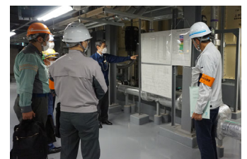
訓練の様子(横浜市役所本庁舎)