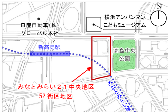
位置図及び都市再生特別地区の提案区域