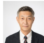
建築局公共建築部長