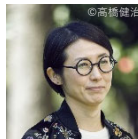
建築家、横浜国立大学教授