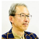
建築家、東京都立大学大学院教授