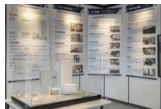
31階での展示(イメージ)