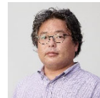
東北大学大学院教授