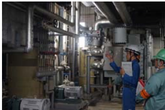
※昨年度実施された訓練の様子。出動者が被害想定箇所の安全点検を行いました。

建築・電気設備・機械設備の各業種が一体となって出動班を編成するため、応急措置にあたって連携を図ることができます