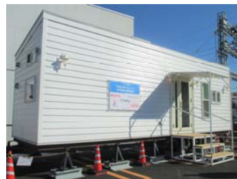
IoT スマートホームの実証実験