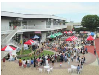
いずみ野マルシェ