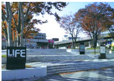
南万騎が原駅周辺の再整備

このたび、協定締結から 6 年目を迎え、沿線で活動を行っている地域、大学、企業のみならず、さまざまな取組のご紹介をいただき、地域への想いをお話いただくことで、じぶんたちのまちの未来を一緒に考え、より多くの方々に取組に参加していただくきっかけとする場として、第 2 回目のまちづくりフォーラムを開催します。今後、SDGs 未来都市「大都市モデル」の創出につなげ、よりよい未来を目指していきます。