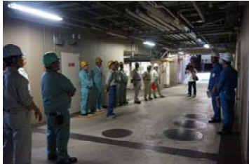
※昨年度実施された訓練の様子。出動者が被害想定箇所の安全点検を行いました。

建築・電気設備・機械設備の各業種が一体となって出動班を編成するため、応急措置にあたって連携を図ることができます