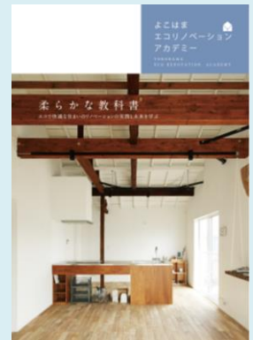
冊子「柔らかな教科書」

また、環境性能や住宅の機能・価値を高めるエコリノベーションについて学ぶ場「よこはまエコリノベーション・アカデミー」を開催します。 5月20日（金）のアカデミーでは、これまでに開催したアカデミーの成果をまとめた冊子「柔らかな教科書」の内容を紹介 します。