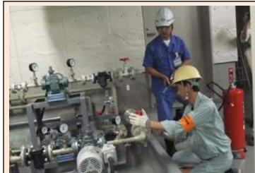
※昨年度実施された訓練の様子 出動者が被害想定箇所の安全点検を行いました。

建築・電気設備・機械設備の各業種が一体となって出動班を編成するため、応急措置にあたって連携を図ることができます