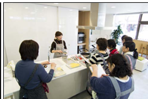
▲料理教室の風景イメージ