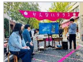
▲昨年度の様子(関内フード&ハイカラフェスタ)