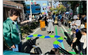
イベントでの検証