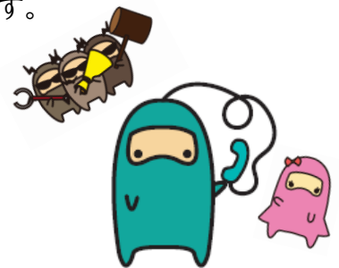
横浜市消費生活総合センター 啓発キャラクター「はまのタスケ」