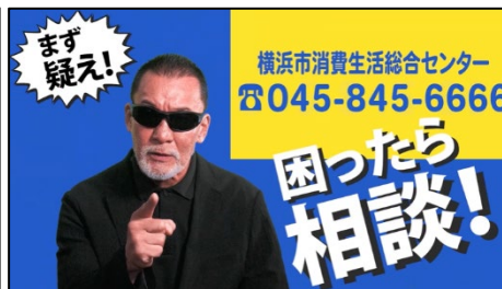
<動画イメージ>「蝶野 正洋」氏出演動画