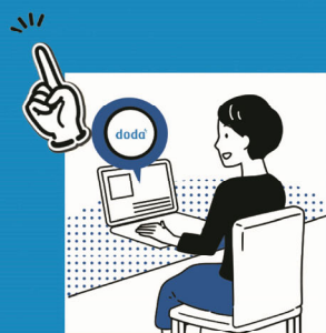
dodaへの 長期求人掲載