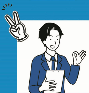
求人内容に関する 個別アドバイス