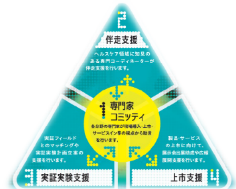
デジタルヘルスケアサポート拠点 サポートメニュー

デジタルヘルスケア分野での新技术・新製品の開発を支援する拠点を令和3年4月1日に開設しました。この拠点では、IoT分野の「I-TOP 横浜」と健康・医療分野の「LIP 横浜」の2つのプラットフォームのネットワークを活用して、横浜企業経営支援財団、木原記念横浜生命科学振興財団及び横浜市が、スタートアップや中小企業の製品化に向けた支援や新たなビジネス創出の支援を行います。