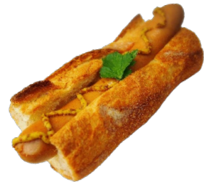
ジャーマン・ホットドッグ <イメージ画像>