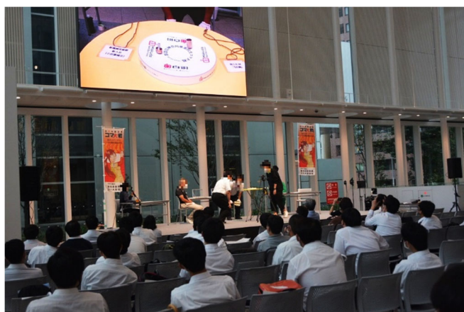
▲昨年度大会の様子