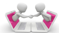
ネットワーキング