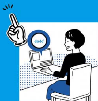
dodaへの 長期求人掲載