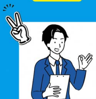
求人内容に関する 個別アドバイス