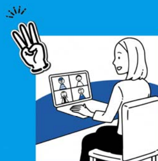
採用に関する セミナーへの参加

dodaの原稿掲載料は1ヵ月定価25万円ですが、今回 3万円+税のみ で長期掲載が可能です。 さらに人材採用専門家による コンサルティング や セミナー を特別にお受けいただけます!